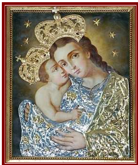
Obraz Matki Bożej Pocieszenia w Zakrzewie

Zakrzewo to parafia bardzo stara, gdyż pierwsze informacje o jej istnieniu pochodzą już z 1387 r. Dokładniejsze informacje o jej początkach giną jednak w pomroce dziejów. Natomiast historia obecnej świątyni i kultu maryjnego, to już czasy o wiele nam bliższe.