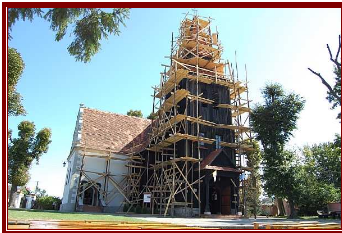
Kościół parafialny pw. św. Klemensa w Zakrzewie (2008)

przedmiotów - m.in. zrabowano wota, jakie przez wieki były składane przy ołtarzu Matki Bożej z wdzięczności za otrzymane za Jej pośrednictwem łaski. Sam obraz pozostał jednak nienaruszony. Był on bowiem (i jest do dziś) zastawiany przez wizerunek Matki Bożej Bolesnej o dużo mniejszej wartości tak materialnej jak i sakralnej. Jak podaje lokalna tradycja, linka służąca do jego podnoszenia, została wcześniej przecięta, co sprawiło, że okupanci nawet nie podejrzewali, iż za tym malowidłem znajduje się drugie, cudowne, a więc i o wiele cenniejsze.